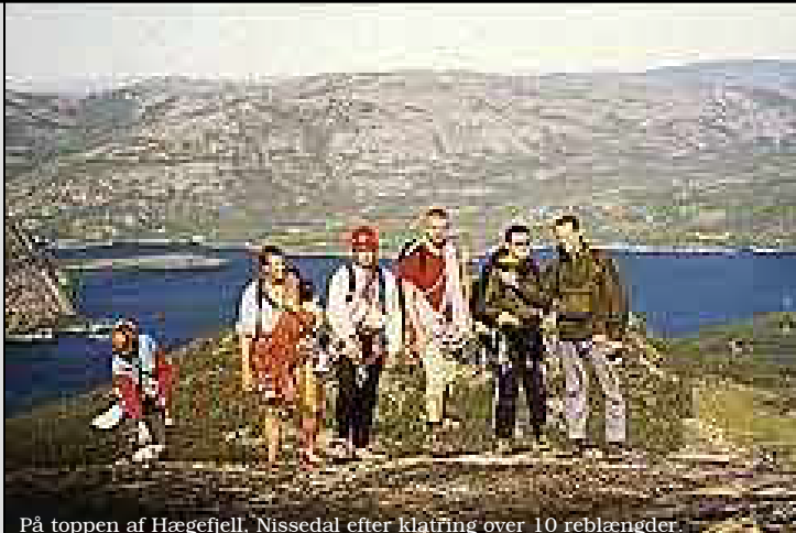
På toppen af Hægefjell, Nissedal efter klatring over 10 reblængder.

Du er velkommen til at kontakte os, hvis du har spørgsmål mm. Jeg ser frem til at høre fra dig.